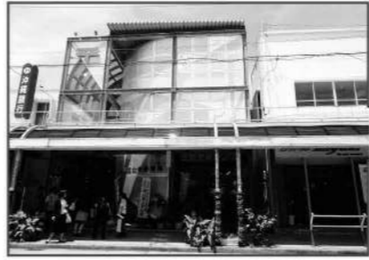
名護大中郵便局2階