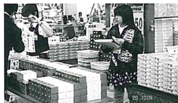
沖縄フルーツランド(株)