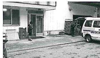
(有)やんばるライフ