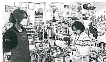
コミュニティーショップまぐくる