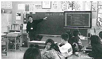
ジョブシャドウイング説明中