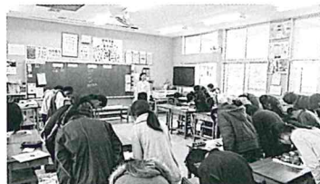
マナー講習でお辞儀の練習