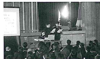
後半は代表者の発表

生徒達のコメント 「色々なことをいっぱい勉強して、働くことの大変さ、大切さ、楽しさを知り、すごくいい勉強になりました。勉強したことを、これから活かせるように頑張ろうと思いました。」 「今はまだ夢はないけれど、今まで学んできたことを活かして、自分にとってやりがいのある職業に就きたい。」